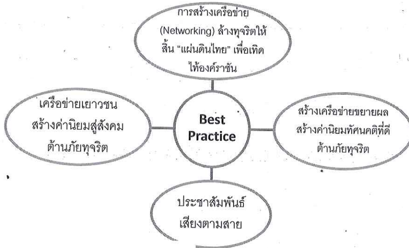
แผนภูมิที่ 3 กิจกรรมเสริมสร้างและขยายเครือข่ายสู่สถานศึกษาและชุมชน

กิจกรรมเสริมสร้างและขยายเครือข่ายสู่สถานศึกษาและชุมชนที่ใกล้เคียงเพื่อให้เด็กได้เรียนรู้วิถีชีวิตของชุมชน เรียนรู้วัฒนธรรม ความเป็นอยู่ของชุมชน และให้ความรู้ด้านกฎหมายแก่ชุมชน เพื่อให้ชุมชนและโรงเรียนได้รวมกันเป็นเครือข่ายที่เข้มแข็งในการป้องกันปัญหาการทุจริตคอร์รัปชันในชุมชน และเสริมสร้างให้เด็กและเยาวชนเป็นคนดีของสังคม การสร้างเครือข่าย (Networking) ล้างทุจริตให้สิ้น “แผ่นดินไทย” เพื่อเทิดไท้องคราชน, กิจกรรมประชาสัมพันธ์เสียงตามสาย กิจกรรมเครือข่ายเยาวชน สร้างค่านิยม สู่สังคม ด้านภัยทุจริต กิจกรรมสร้างเครือข่ายขยายผล สร้างค่านิยม ทศนคติที่ดี ด้านภัยทุจริต ดังแสดงในแผนภูมิที่ 3