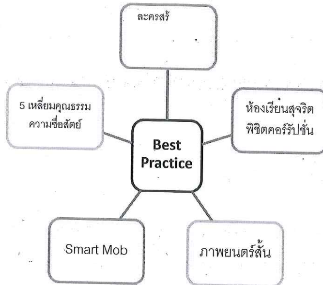
แผนภูมิที่ 2 กิจกรรมการพัฒนาทักษะชีวิต คุณธรรม จริยธรรม

กิจกรรมการพัฒนาทักษะชีวิตคุณธรรมจริยธรรม มุ่งเน้นให้เด็กและเยาวชนดำเนินกิจกรรมที่ส่งเสริมให้เกิดทักษะในชีวิต ได้แก่ ละครสร้างสรรค์ความซื่อสัตย์สุจริตต้านภัยทุจริต กิจกรรม 5 เหลี่ยม คุณธรรมความซื่อสัตย์ กิจกรรมห้องเรียนสุจริตพิชิตคอรัปชั่น กิจกรรม Smart Mob กิจกรรมภาพยนตร์สั้น ดังแสดงในแผนภูมิที่ 2