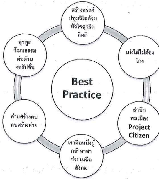
แผนภูมิที่ 1 กิจกรรมเพื่อปลูกจิตสำนึก ค่านิยมและทัศนคติที่ถูกต้องในเรื่องความยุติธรรม และความซื่อสัตย์สุจริต อันจะทำให้เกิดการมีส่วนร่วมในการต่อต้านการทุจริตคอรัปชั่น