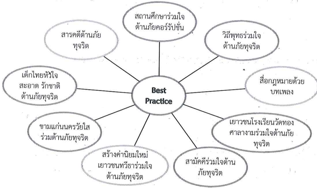
แผนภูมิที่ 5.4 กิจกรรมเสริมสร้างและขยายเครือข่ายสู่สถานศึกษาและชุมชนที่ใกล้เคียง

ผลการดำเนินงานโครงการสร้างค่านิยมใหม่ เยาวชนร่วมใจ ด้านภัยทุจริต ทำให้เกิดนักเรียนแกนนำและสถานศึกษาที่เป็นต้นแบบในการสร้างค่านิยมและทัศนคติเกี่ยวกับความซื่อสัตย์สุจริต และยุติธรรม และการให้ความรู้เกี่ยวกับแนวคิดและกฎหมายที่เกี่ยวข้องกับการป้องกันการทุจริตคอร์รัปชัน โดยการดำเนินกิจกรรมเพื่อเด็กและเยาวชนนี้จะเป็นส่วนที่สำคัญอย่างยิ่งในการสร้างพลังของเครือข่ายเด็กและเยาวชนในสถานศึกษา ในการถ่ายทอดกิจกรรมไปยังนักเรียนคนอื่นๆ และมีความสามารถในการดำเนินกิจกรรมที่เกี่ยวกับการต่อต้านการทุจริตคอร์รัปชันและการมีส่วนร่วมในการต่อต้านการทุจริตคอร์รัปชัน การสร้างโรงเรียนต้นแบบในการต่อต้านการทุจริตคอร์รัปชันโดยมีเป้าหมายและทิศทางไปในทางเดียวกันคือก่อให้เกิดเด็กและเยาวชนไทยที่มีความซื่อสัตย์ สุจริตและยุติธรรมในอนาคตต่อไป